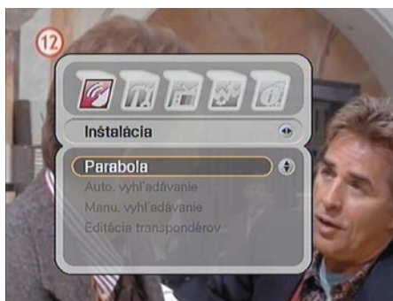
Hlavné menu - Inštalácia